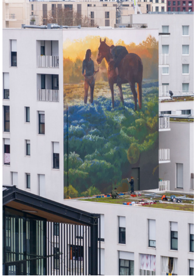
▲ Bègles (2025)