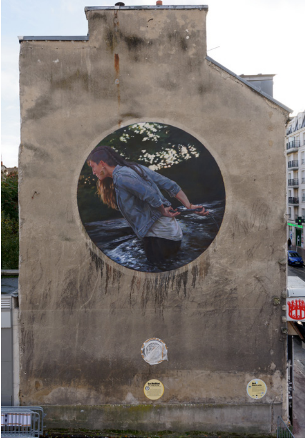
▲ Halway through Le hublot, Montrouge (2024)