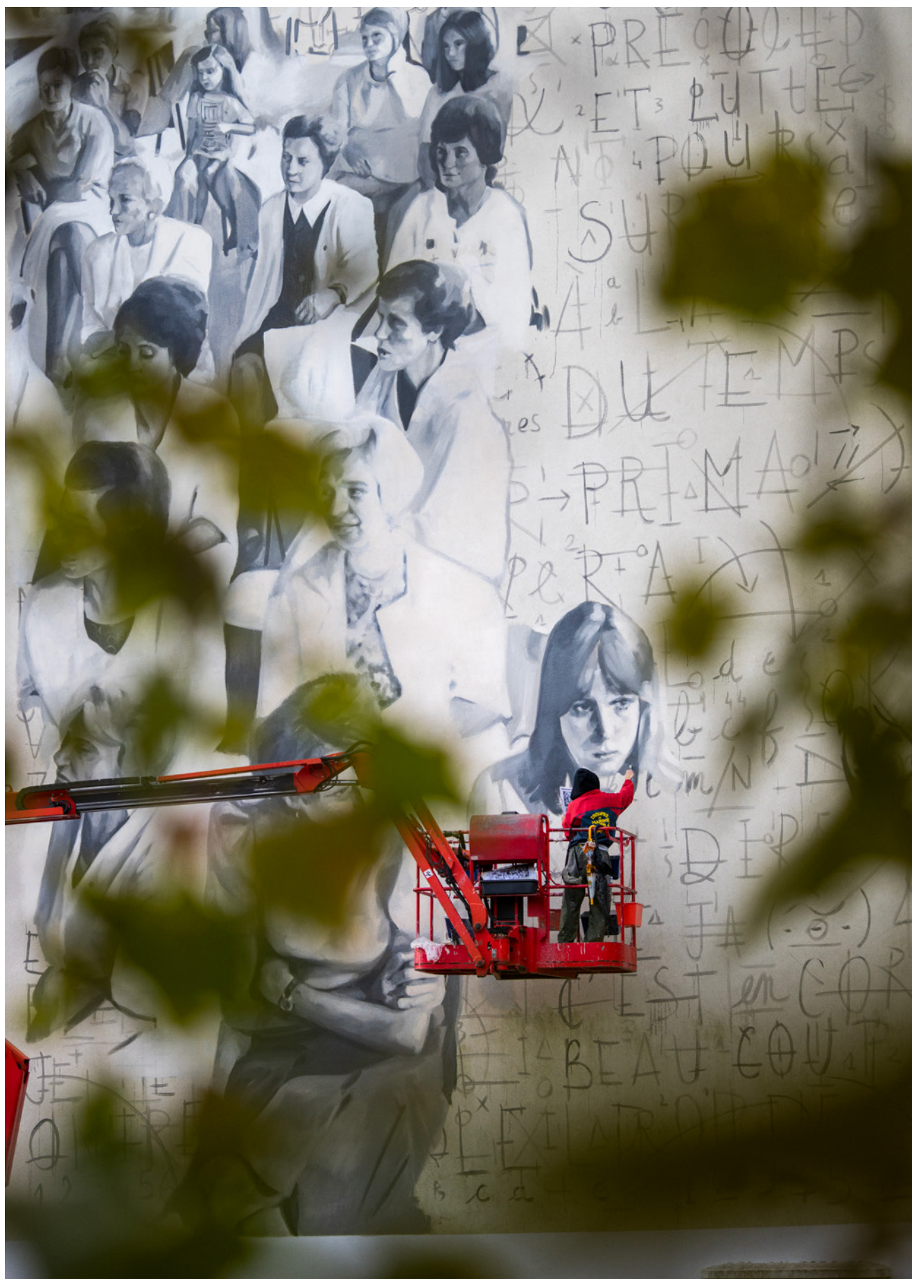
▼ Contrechamps - Rhizome, Besançon (2023)