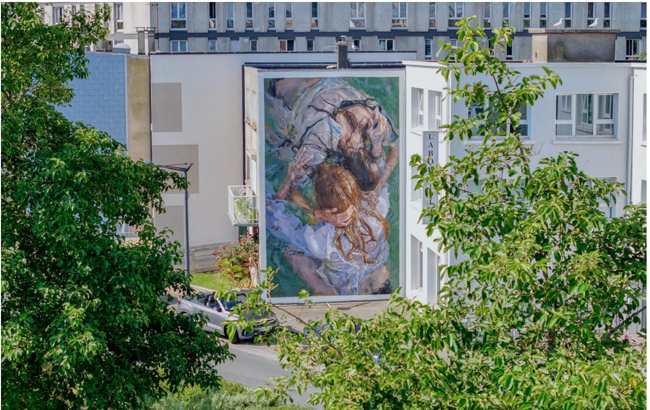
▼ Boulogne, Sister let's go down (2024)